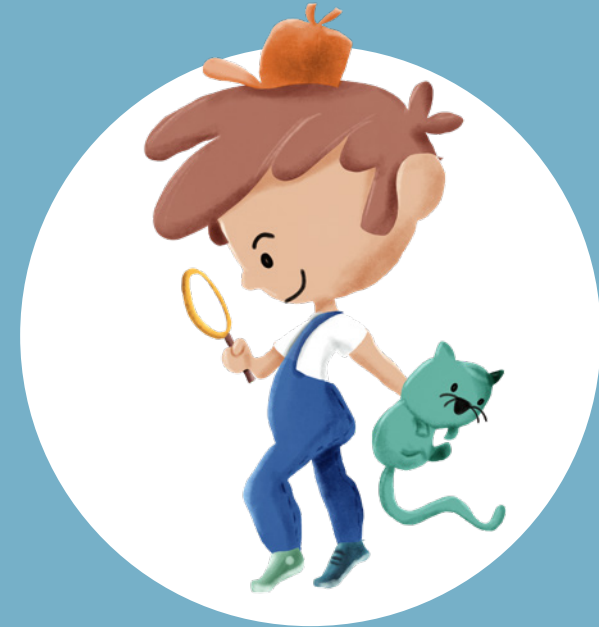
Ilustração DOUGLAS CARVALHO